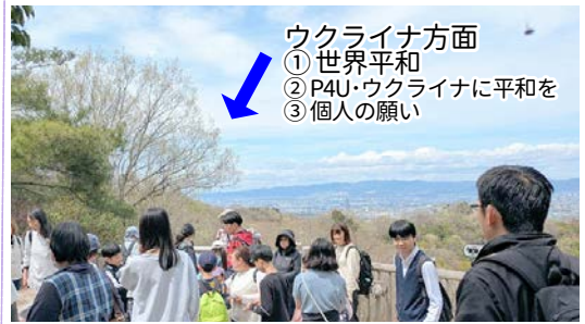
展望台より各自世界平和祈願