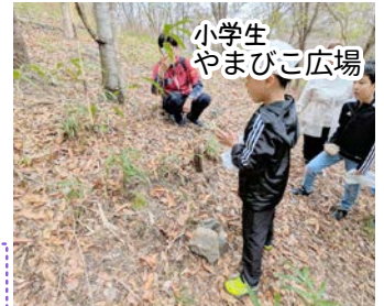
小学生 やまびこ広場

野外研修は先ず、教化部で石上げの石に願いを刻み、ほしだ園地の麓にある「磐船神社」に参拝、クリーンウォーキングしながら標高180mを登り、ムスピ岩で祈願。昼食は大豆ミートのハンバーガー。最後は頂上展望台でP4U・世界平和祈願をしました。