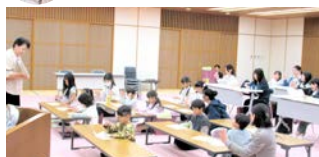
真理で学力向上の秘訣を学び各自で学習