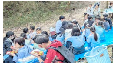
昼食のソイバーガー、おむすび「美味しい〜」