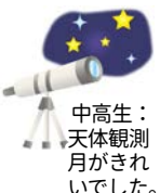
中高生： 天体観測 月がきれい でした。

講話、神想観、浄心行の他小学生の部では西口講師による「みんなで歌おう」の時間で絵本に続いて、ビリーブなどを歌いました。尚、中高生は小学生の部の運営委員として活躍しました。