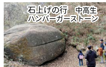
石上げの行 中高生 ハンバーガーストーン