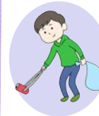
クリーンウォーキング