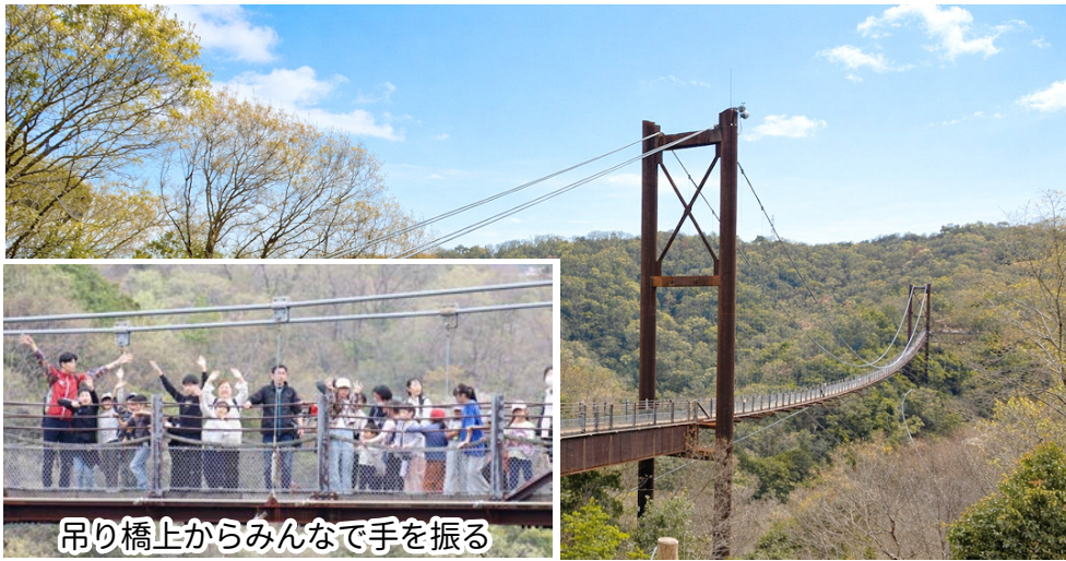
吊り橋上からみんなで手を振る