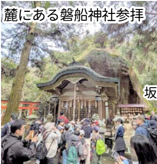
麓にある磐船神社参拝