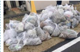
わずか1時間ほどでこのゴミの量(30袋ぐらい)