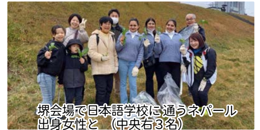
堺会場で日本語学校に通うネパール出身女性と (中央右3名)