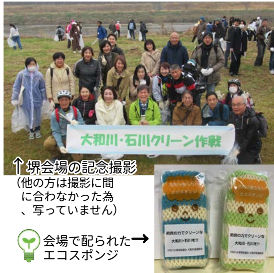
↑堺会場の記念撮影 (他の方は撮影に間に合わなかった為、写っていません)