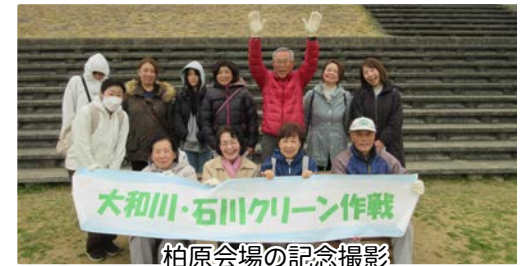
柏原会場の記念撮影