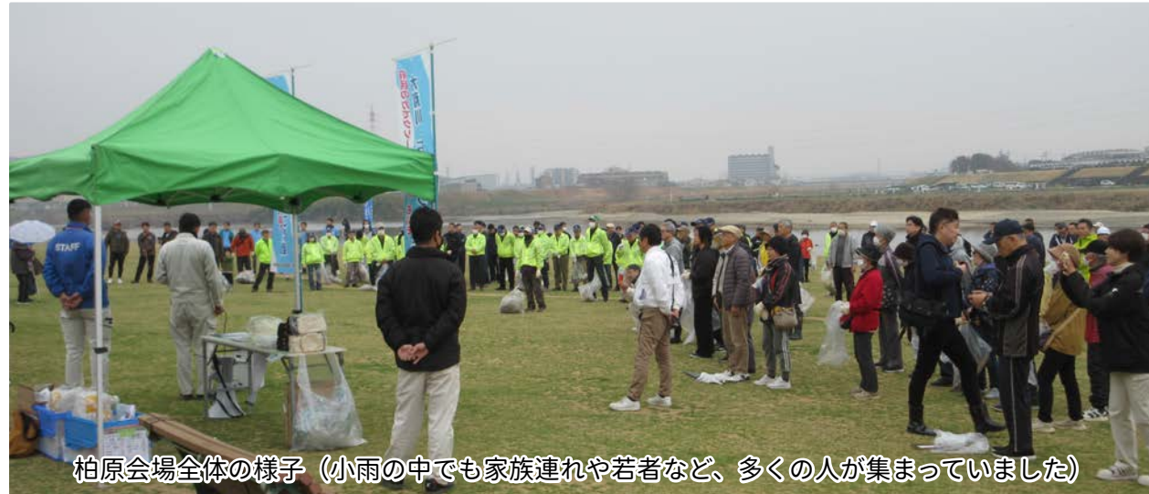
柏原会場全体の様子 (小雨の中でも家族連れや若者など、多くの人が集まっています)