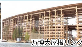
万博大屋根リング