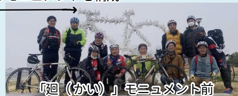
「廻(かい)」モニュメント前