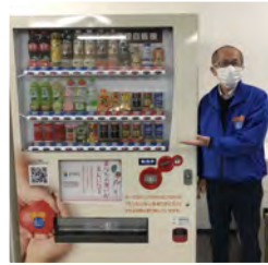
ふーどぼんくOSAKAの活動を応援していただくため、コロナとタッグを組み、支援型自販機を設置

その他新しい支援として生活が苦しい方に対して、「その時ある食品をおすすわけする」「おすすわけ食宅配支援・食おすすわけマーケット」なども実施