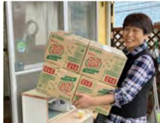
羽曳野周辺の施設3ヶ所に配送作業