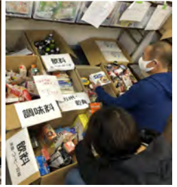
集まったフードドライブ商品の仕分け