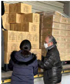
八尾空港に隣接した大阪府中部広域防災拠点で備蓄していた水、米の引き取り作業