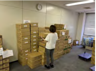
お菓子メーカーから箱詰めされたチョコレート80箱の引き取り作業