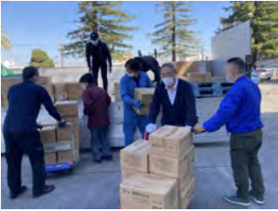
食品をふーどぼんくOSAKAの倉庫に搬入する倉庫作業(ふーどぼんくの職員の方)

大阪教化部では毎月当番を決め3名の職員が堺市にある事務所に行き「ふーどぼんくOSAKA」に登録されている食品関連業者からの引き取り作業、商品を倉庫に保管する倉庫作業、福祉施設などへの配送作業、をさせて頂いております。