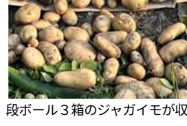
段ボール3箱のジャガイモが収穫