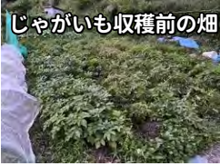
じゃがいも収穫前の畑

<参加者感想> 大きなじゃがいも たくさん収穫できました。神様からの贈り物です!!自然の力で育った地元の野菜の恵みを来館されるオープン食堂や見真会の参加者に食べて頂きたいです。