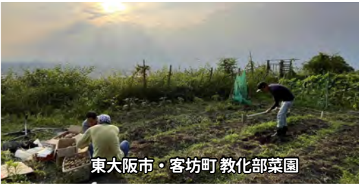
東大阪市・客坊町 教化部菜園