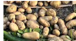
段ボール3箱のジャガイモが収穫