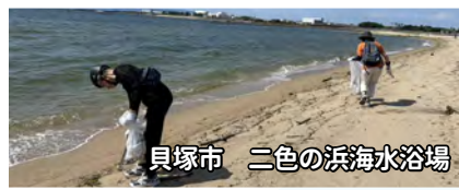
貝塚市 二色の浜海水浴場