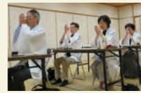
講師会の方々・運営委員会の皆様の祈り