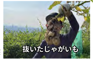
抜いたじゃがいも