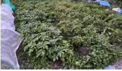
じゃがいも収穫前の畑

大きなじゃがいも たくさん収穫できました。神様からの贈り物です!!自然の力で育った地元の野菜の恵みを来館されるオープン食堂や見真会の参加者に食べて頂きたいです。