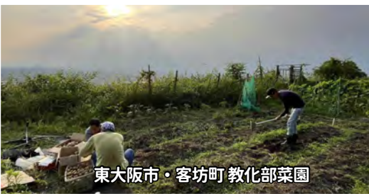
東大阪市・客坊町 教化部菜園